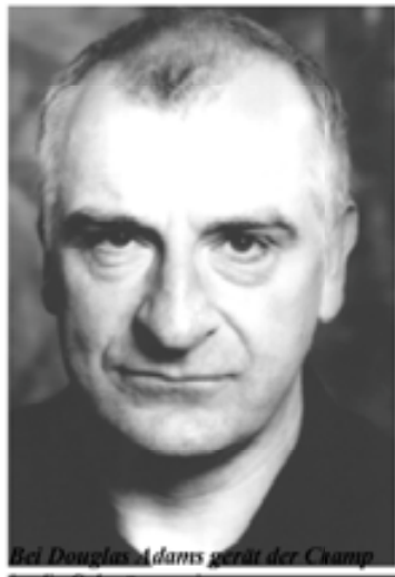
Bei Douglas Adams gerät der Champ in die Schwärmeret.