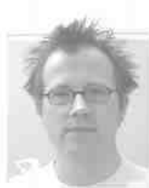
9. Platz: [Name]