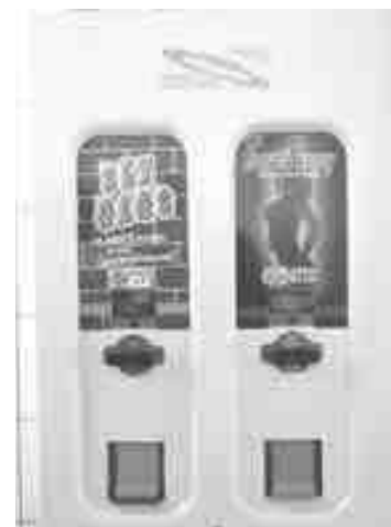
Der Gastgeber hat halt an ALLES auch gedacht.