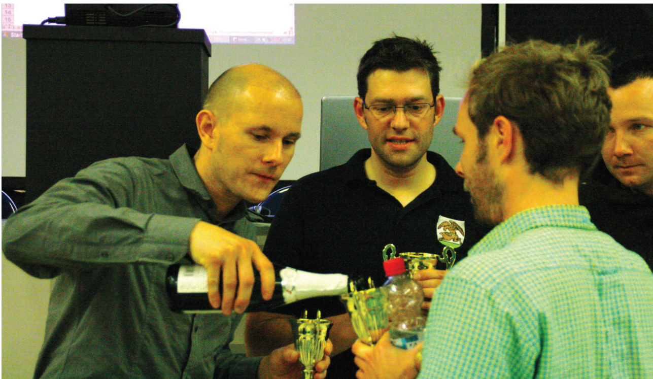
So, Prösterchen. Das war es dann also. Vielen Dank für alles und viel Glück für die Zukunft.