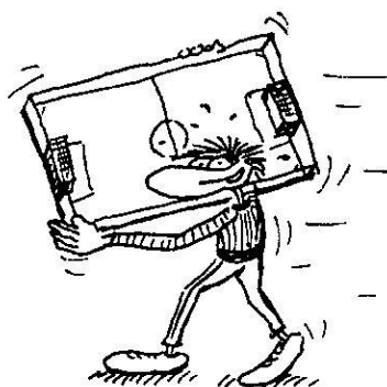
Der einseitige Schultergriff (DeS)

leider trafen die angeforderten Plazierungen noch nicht ein; da das Turnier in der Schweiz stattfand, haben sie ohnehin nur eine unwesentliche Bedeutung.