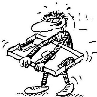
Der symmetrische Vordergriff (DsV)